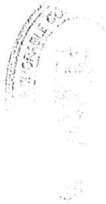
QUILLTAGUERRE MYRIAN ELIZABE PRESIDENTE Honorable Concejo Deliberante Municipalidad de Villa Gesell